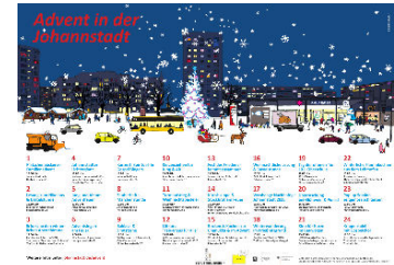
Grafik: Grit Koalick