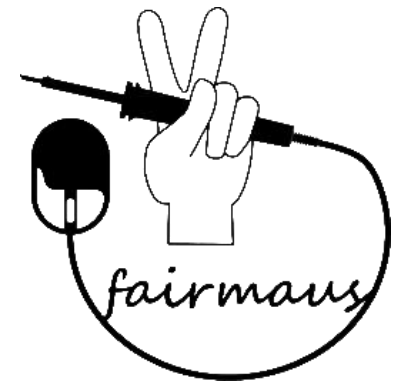
Grafik: Thomas Peterberns