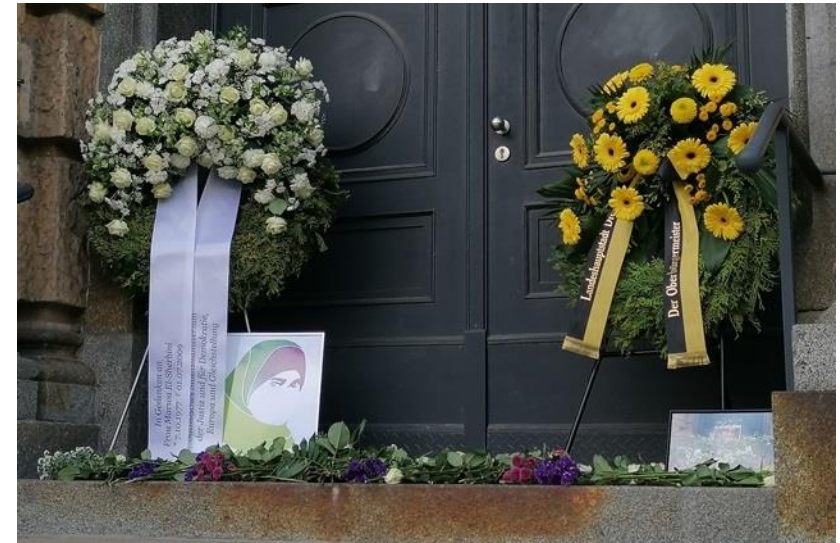
Marwa-El-Sherbini-Gedenken vor dem Hauptportal des Gerichtsgebäudes

Blau umrandete Fläche = Marwa-El-Sherbini-Park Grünschriffierte Fläche = Denkmalschutzgebiet