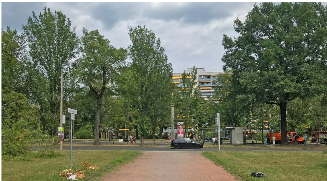
Sichtachse zum östlichen Teil des Sachsenplatzes